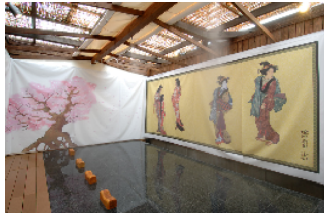
〔 銀泉陣幕岩盤足湯 〕