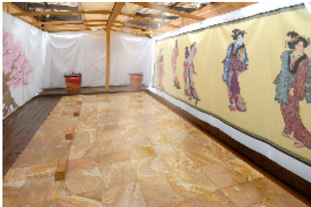
〔 金泉幕湯岩盤足湯 〕