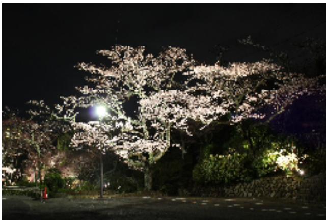
〔 太閤の湯内 桜ライトアップ 〕